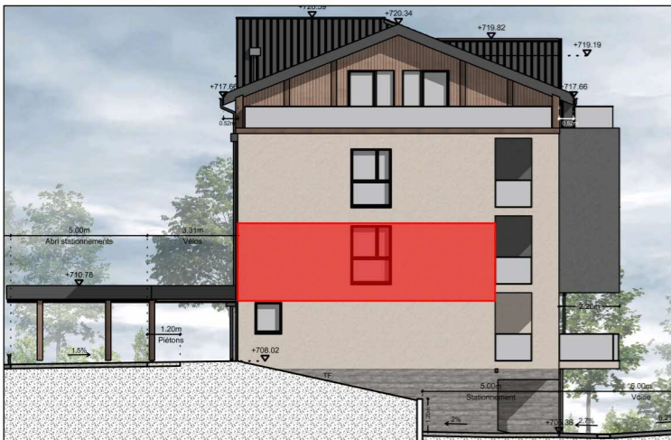
BÂTIMENT A - FAÇADE OUEST