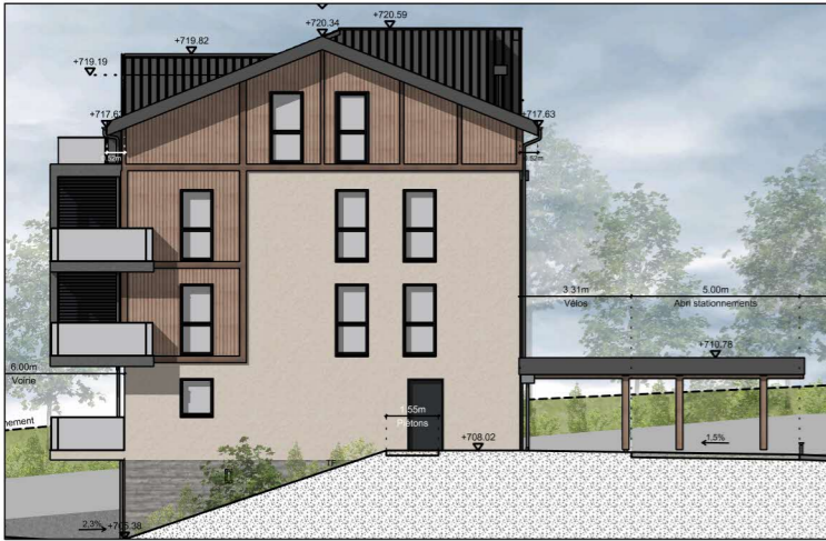
BÂTIMENT A - FAÇADE EST