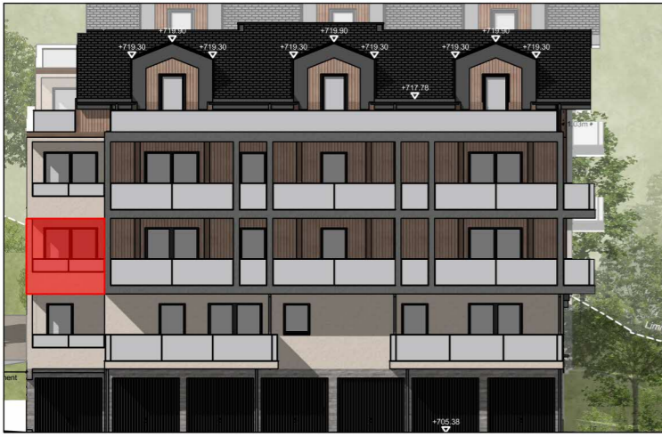
BÂTIMENT A - FAÇADE SUD