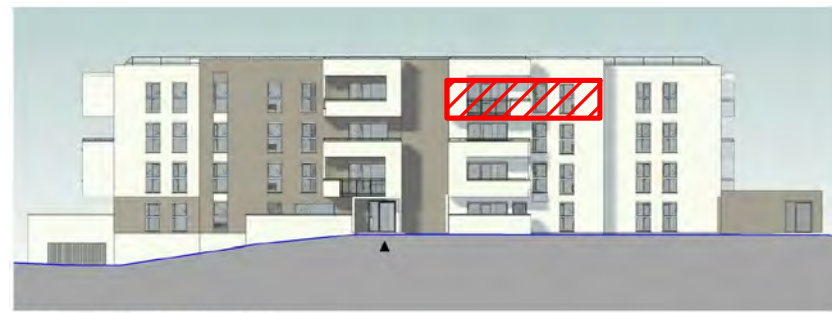
PC5.1 Elévation NORD-OUEST bât.A