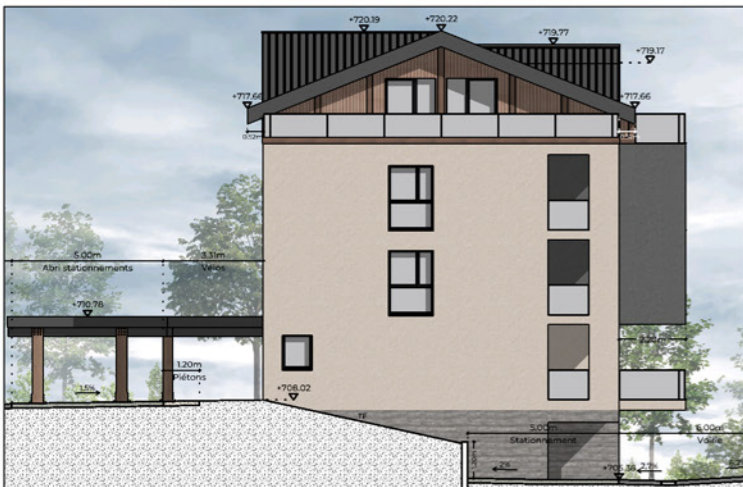
BÂTIMENT A - FAÇADE OUEST