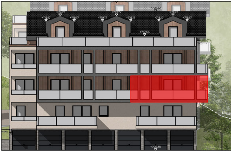
BÂTIMENT A - FAÇADE SUD