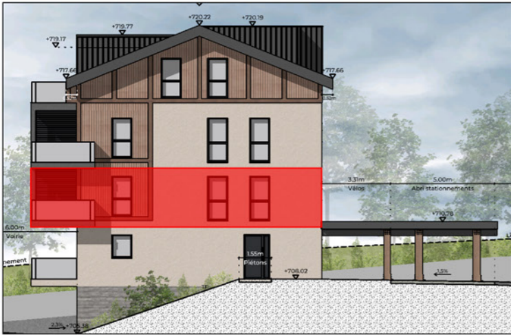
BÂTIMENT A - FAÇADE EST