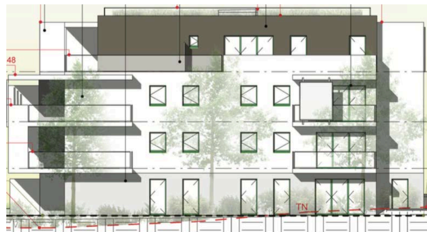
Elévation Sud Est