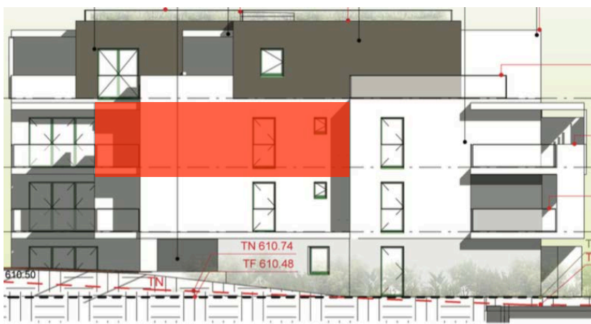
Elévation Nord Ouest