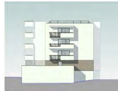
PC5.1 Elévation NORD-EST bât.A