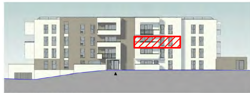
PC5.1 Elévation NORD-OUEST bât.A