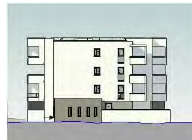
PC5.1 Elévation SUD-OUEST bât.A