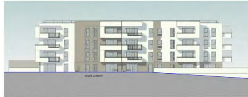
PC5.1 Elévation SUD-EST bât.A