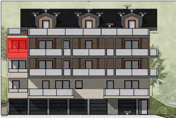
BÂTIMENT A - FAÇADE OUEST