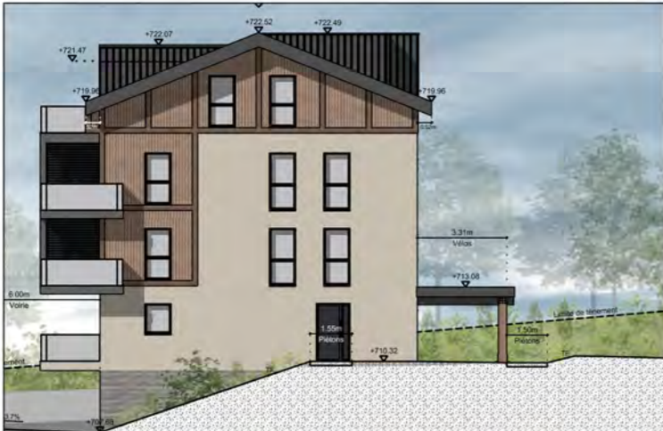
BÂTIMENT A - FAÇADE EST