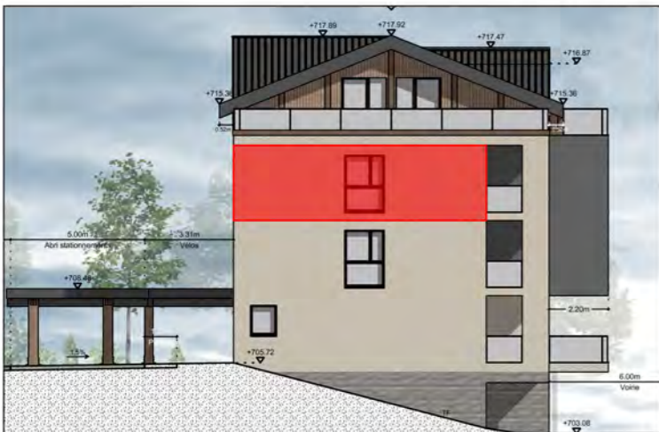
BÂTIMENT A - FAÇADE OUEST