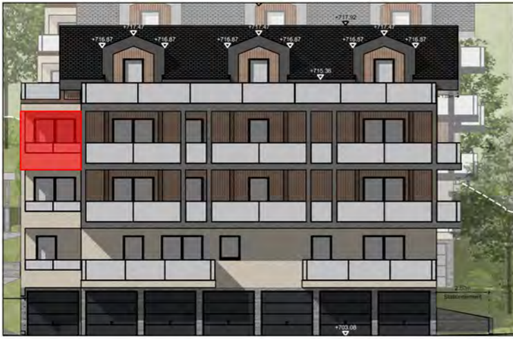
BÂTIMENT A - FAÇADE SUD