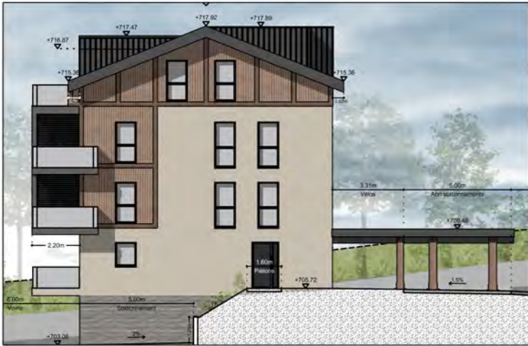
BÂTIMENT A - FAÇADE EST