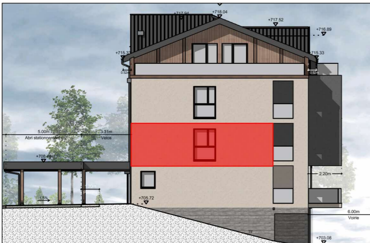
BÂTIMENT A - FAÇADE OUEST