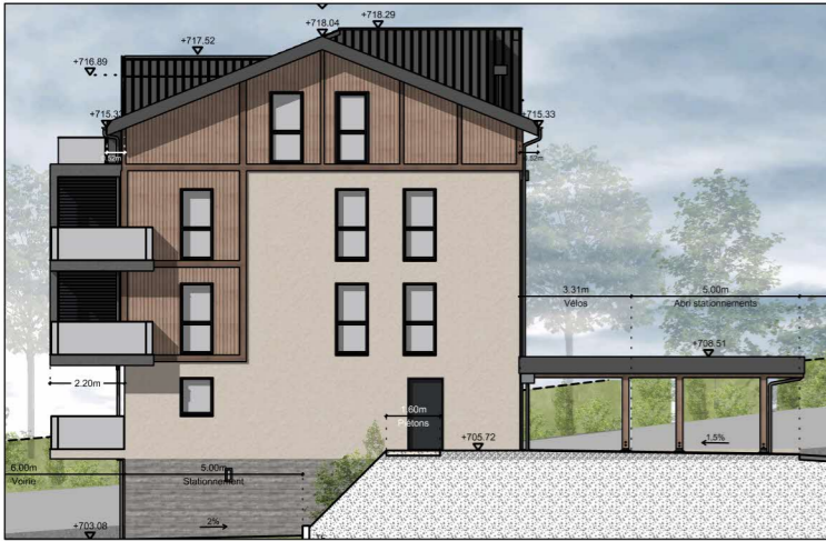
BÂTIMENT A - FAÇADE EST