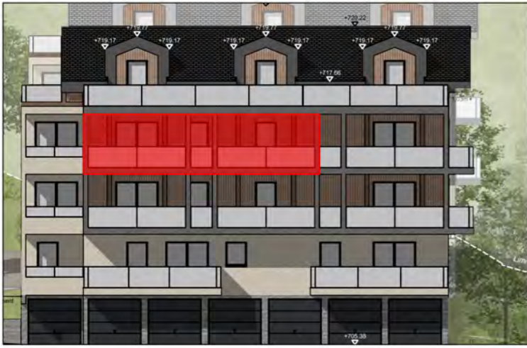
BÂTIMENT A - FAÇADE SUD