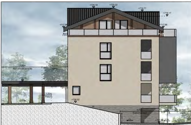
BÂTIMENT A - FAÇADE OUEST